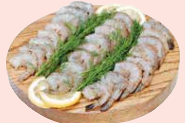
Medium EZ Peel Shrimp Camarón Mediano Fácil de Pelar